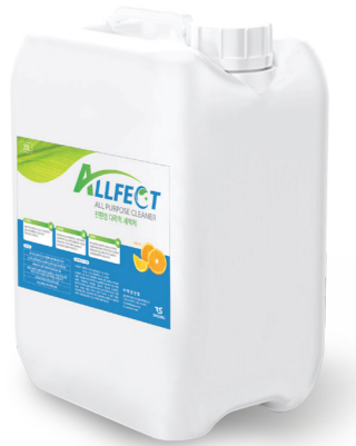
친환경 다목적 세척제 [말통]