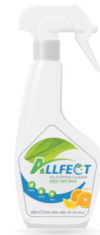
친환경 다목적 세척제 [스프레이]